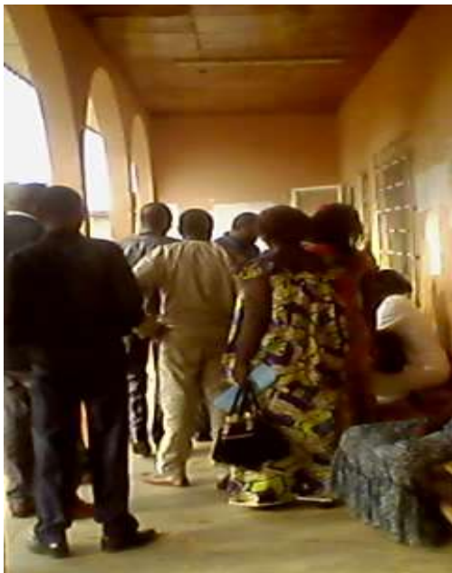
Photo : Atelier de planification : jour3 (Prise de perdiem par les participants)